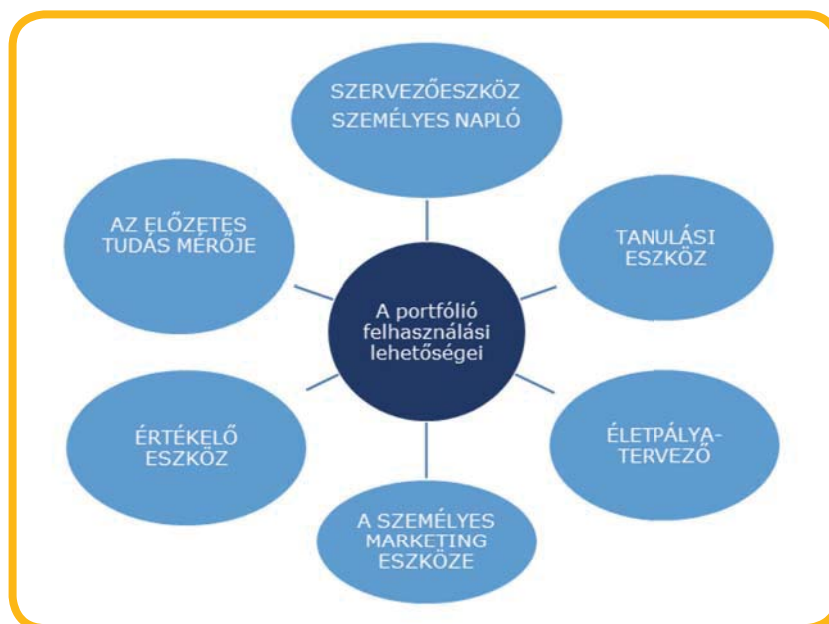
1. ábra A portfólió felhasználási területei a Career Portfolio Guide 2. oldal alapján Forrás: Lásd Irodalomjegyzék 2.

A következő ábra a szakmai portfólió felhaszná- lási területeit mutatja be: